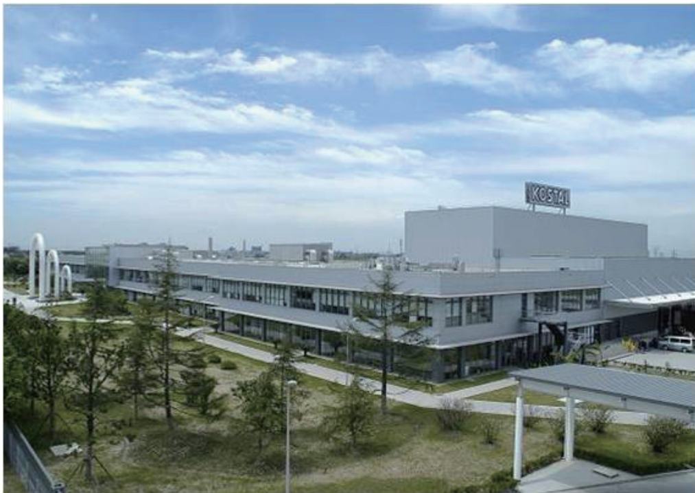
上海科世达一华阳汽车电器有限公司外景

上海科世达一华阳汽车电器有限公司是于1995年创建的中德合资企业，投资三方为德国科世达投资有限公司、贵州航空集团华阳电气有限公司及上海安亭工业经济发展有限公司。德国科世达投资有限公司，创建于1912年，属国际跨国公司，在全球17个国家设有分支机构，主要提供汽车电器系统、工业电器系统、接插件和检测设备的解决方案，主要客户有奔驰、宝马、大众、福特、通用汽车公司等，生产、开发实力雄厚。上海科世达一华阳拥有近两百条装配生产线，配备了多台先进的机器设备，现有员工1800多人。公司主要经营范围是销售、开发、制造汽车电器和电子产品。